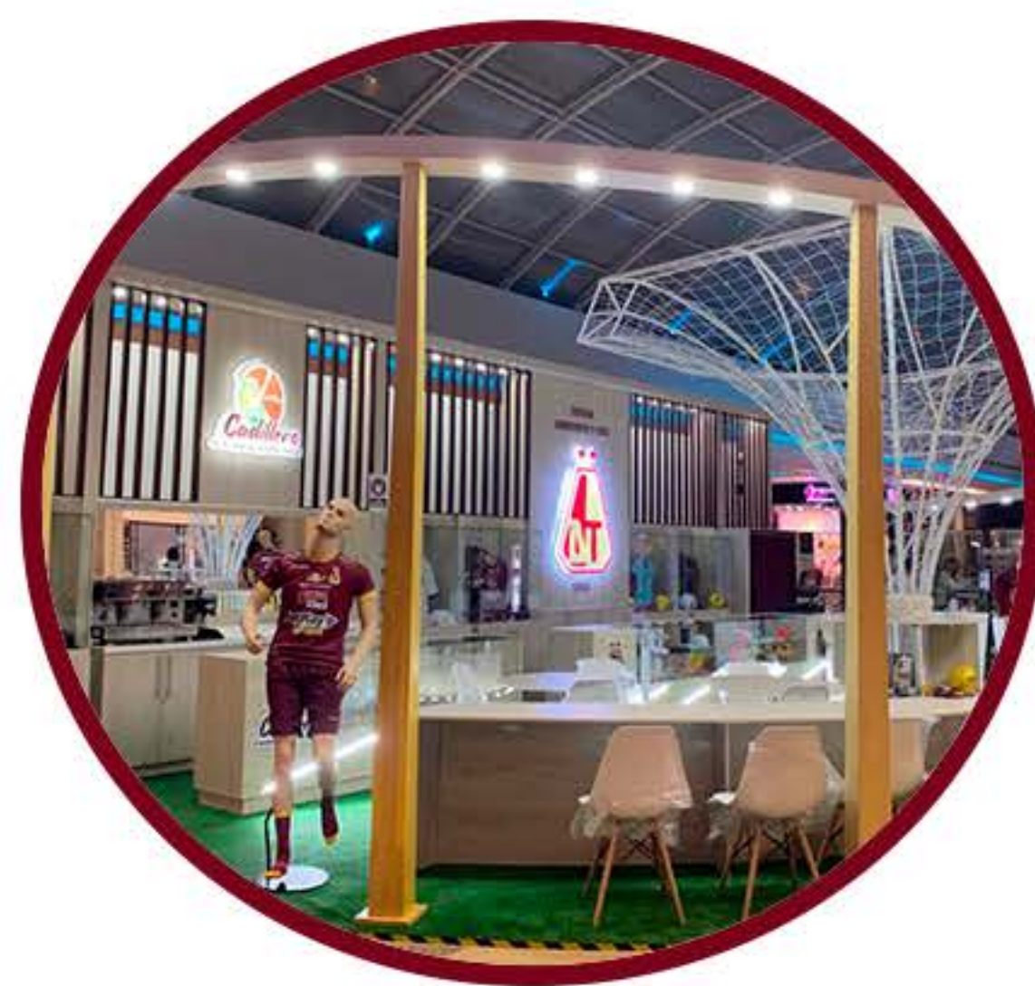
C.C. LA ESTACIÓN SEGUNDO PISO