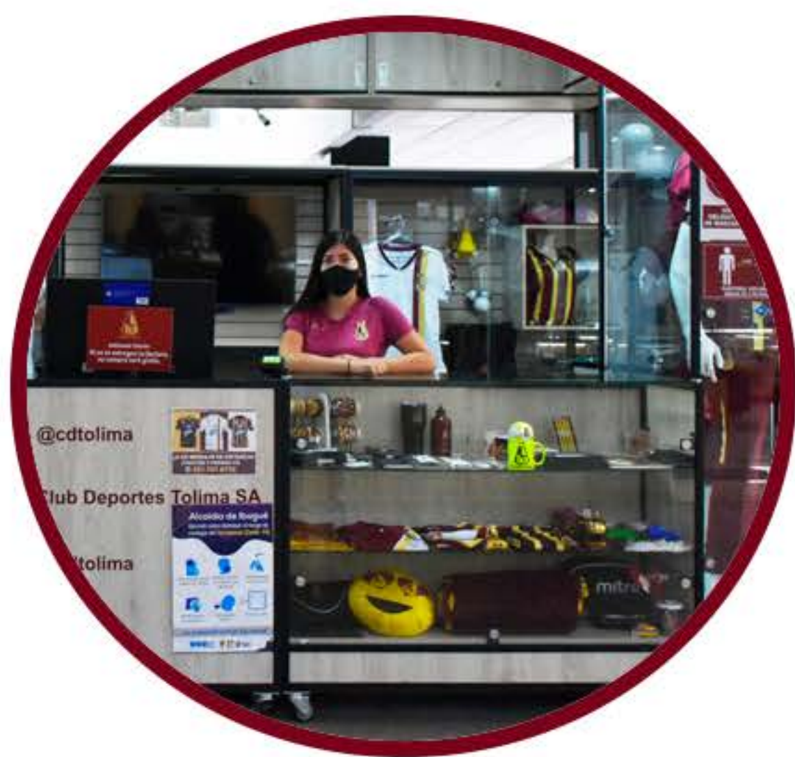
C.C MULTICENTRO 1ER PISO