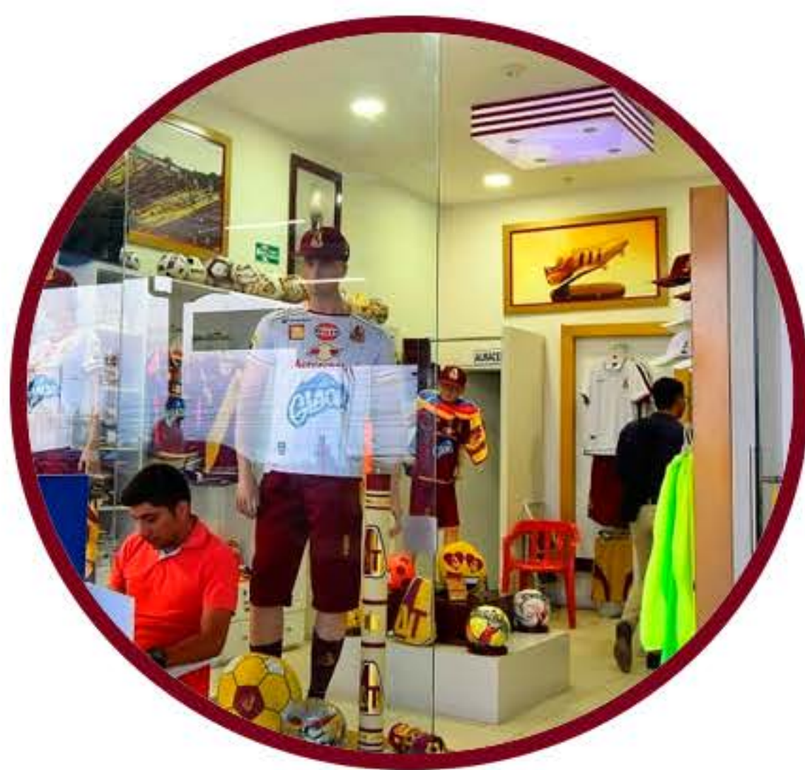
MERCACENTRO #10 EL POBLADO LOCAL 2